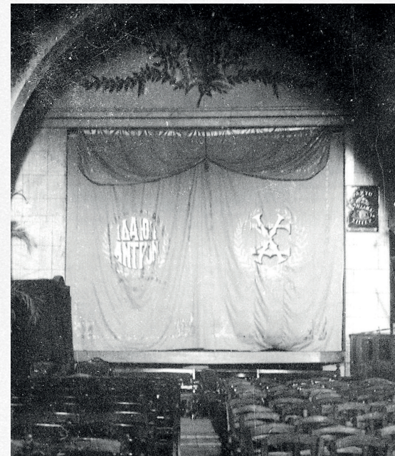
Ο ενετικός Ναός του Αγ. Φραγκίσκου Χανίων ως κινηματοθέατρο «Ιδαίον Αντρον»

Ενετικός Ναός Αγ. Φραγκίσκου Χανίων. Αύλειος χώρος με κρήνη οθωμανικής περιόδου από το μουσουλμανικό τέμενος.