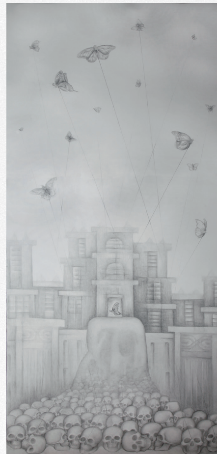
Μιράντα Σκυλουράκη Memento (a)mori – Πόλ(ε)ις Μολύβι σε χαρτί 164 x 73 cm, 2018