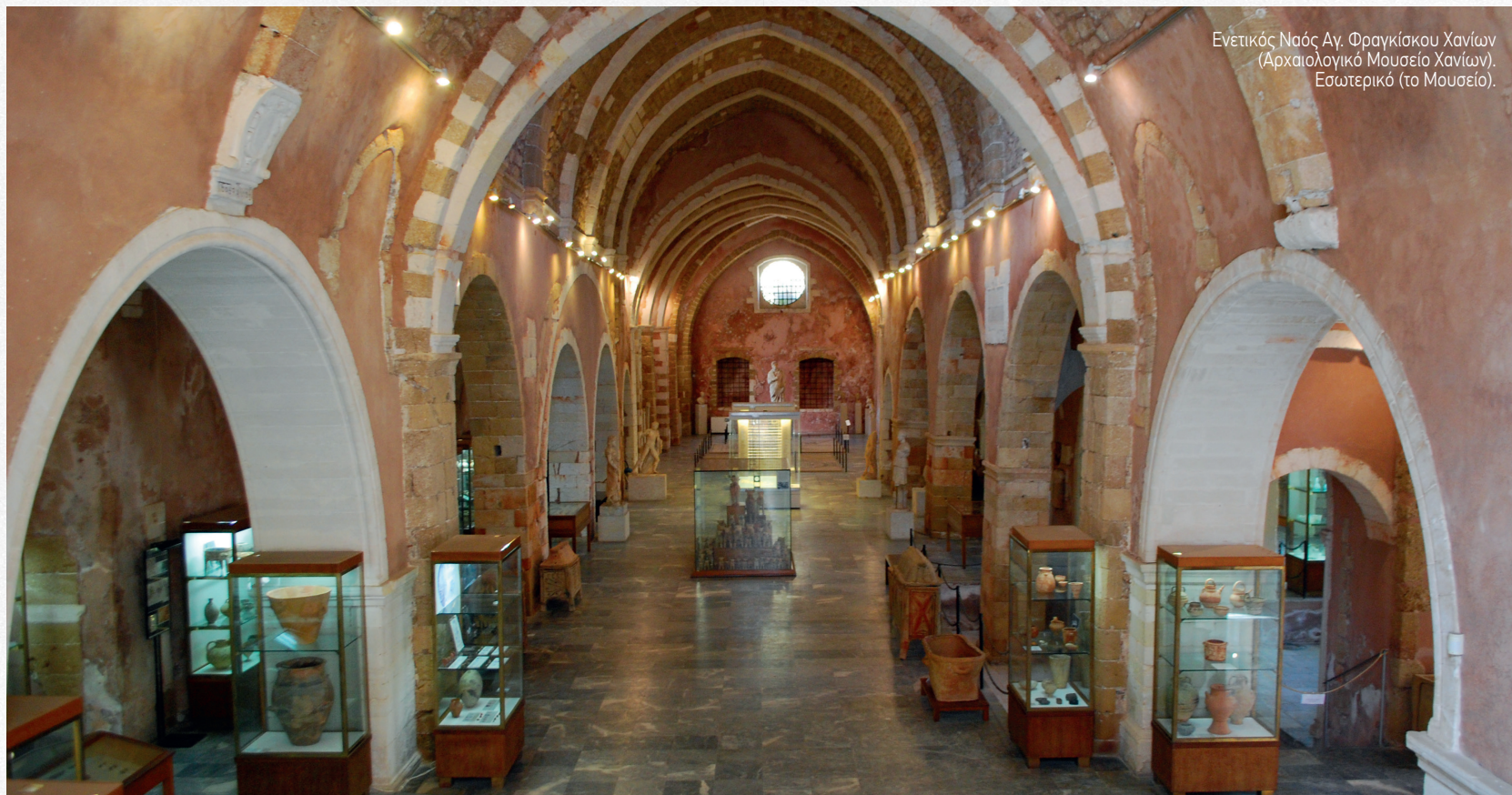
Ενετικός Ναός Αγ. Φραγκίσκου Χανίων (Αρχαιολογικό Μουσείο Χανίων). Εσωτερικό (το Μουσείο).