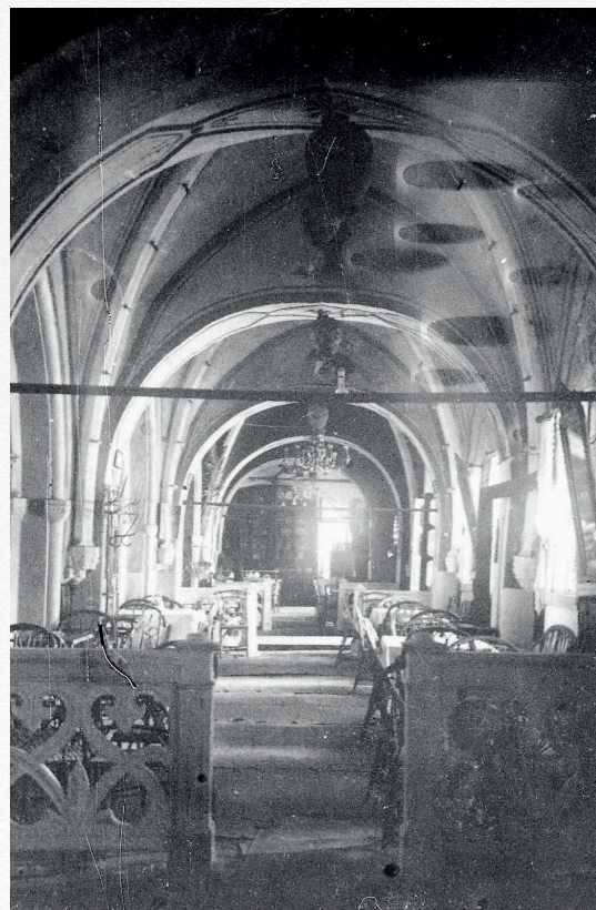
Ο ενετικός Ναός του Αγ. Φραγκίσκου Χανίων ως Καφέ Σαντάν

Ενετικός Ναός Αγ. Φραγκίσκου Χανίων. Αύλειος χώρος με κρήνη οθωμανικής περιόδου από το μουσουλμανικό τέμενος.